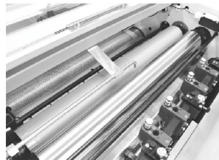
Unité d'application de vernis